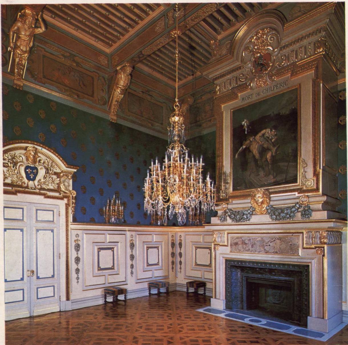
HOTEL DE VILLE DE LYON - SALON LOUIS XIII