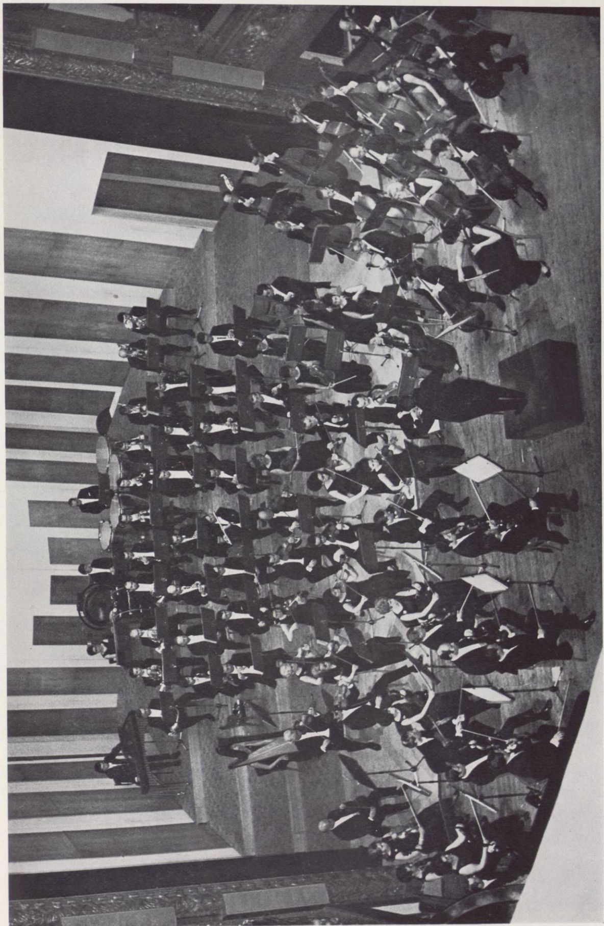
L'Orchestre Philharmonique Rhône-Alpes